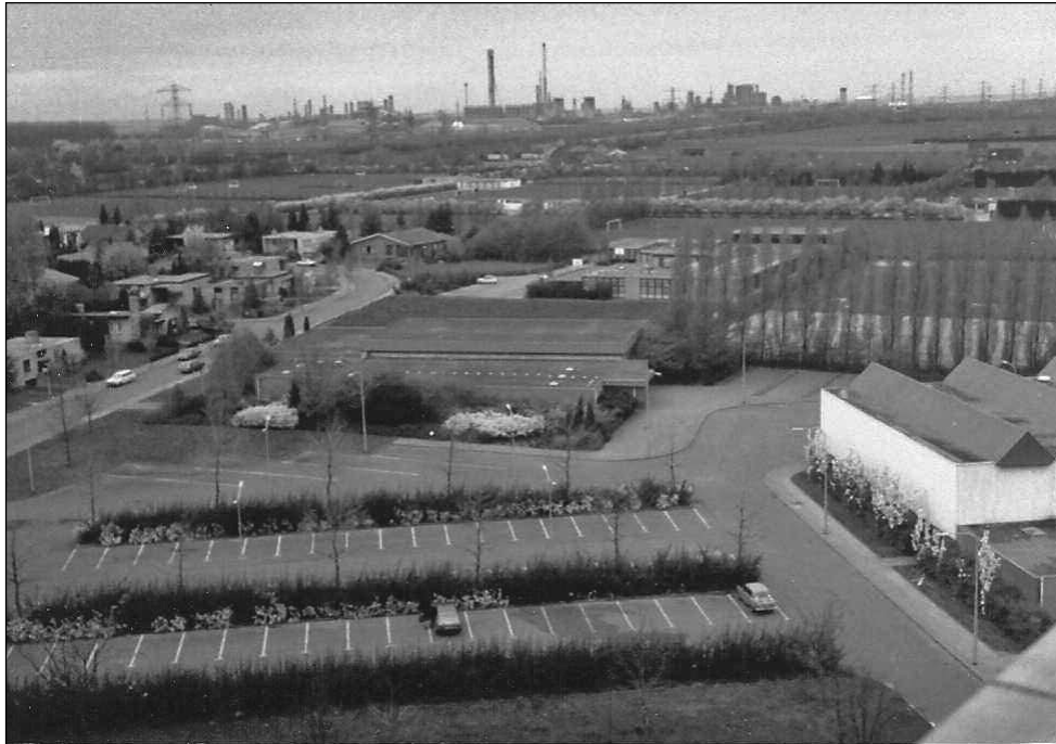
Blik op de sporthal, het zwembad en Mixed in 1982.

Toch ging het niet goed met het zwembad. Men was uitgegaan van 250.000 bezoeken per jaar in het Van Banningbad. De eerste drie jaren waren het er rond de 160.000 per jaar. Daarna daalde het aantal gestaag naar ruim 72.000 in 1978. Hoe kwam dat?