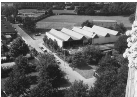
Afbraak van de sporthal in 1988.

Uit een nacalculatie in 1977 bleek dat in totaal 1,2 miljoen gulden was uitgegeven. Aan de architect, de bouw en het meerwerk, de inrichting van de hal, de aanleg van de parkeerplaats en aan het toezicht houden door de gemeente. Het onderwijs gebruikte de hal toen bijna 50 uren per week en anderen een kleine 20 uren. Geen gek resultaat!