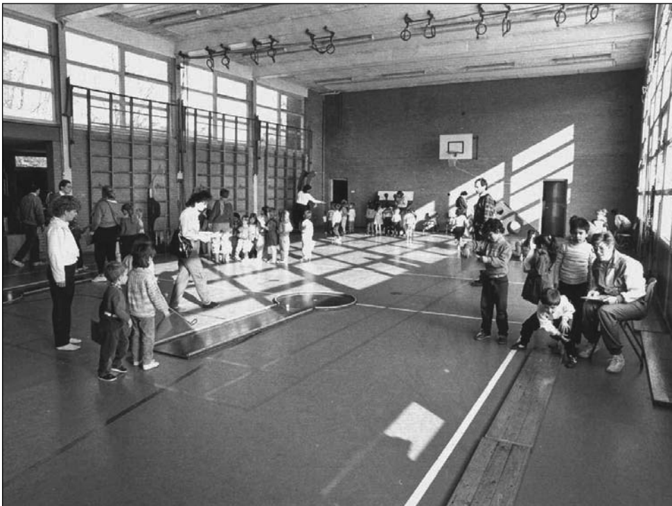
Gymnastiek in de Vermeerstraat in 1968.

Aan de Vermeerstraat en de Gounodstraat liggen twee gymzalen. Beide zalen hebben de afmeting 20 X 12 meter en zijn 5 meter hoog. Met een kleedlokaal voor dames en een voor heren. Ze hebben geen kantine. Ze werden en worden gebruikt door leerlingen en volwassenen en voor naschoolse activiteiten.