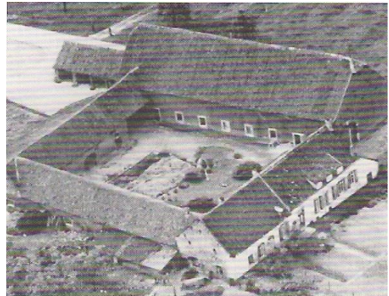
Biesenhof Geleen anno 1930.

De vier bouwvleugels van de Biesenhof zijn haaks op elkaar geplaatst zodat een gesloten binnenplaats wordt gevormd. De vierbouwdelen omvatten het woonhuis met bakhuis aan de oostzijde, de graan- of de oogstschuur aan de noordzijde, de stallen