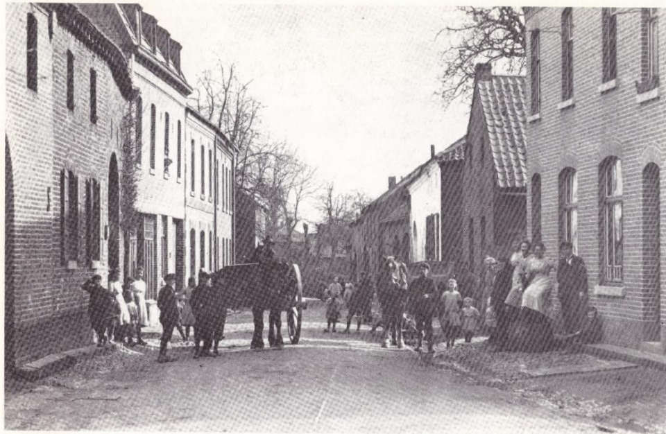
106. De Daalstraat van west naar oost omstreeks 1918. Het eerste huis rechts was het tweede huis vanaf de Rijksweg. Dit was het café van Lambert Geurts; twee van zijn dochters staan of zitten op enkele biervaten. In het volgende gebouw, met de spits toelopende straatgevel, was zijn smidse gevestigd. Achter de rechter kar lag een waterput met een katrol en twee emmers. Over het rechter paard heen kan men aan een gevel de gekrulde arm van een petroleum straatlantaarn zien. Links is nog een klein gedeelte van de poort van Willem Rouschop te zien; daar woont thans zijn zoon Zef Rouschop. Dan volgt de boerderij van Frits Kösters; zijn dochter Lies staat voor de poort. Deze laatste zou met Th. van Neer huwen en in het ouderlijk huis blijven wonen. Op de linker kar zit Gus Keulen, die van de molen van St. Jansgeleen huiswaarts keert. De bomen op de achtergrond staan langs de Keutelbeek.

De Daalstraat is een van de oudste in oost-west richting lopende wegen van Geleen naar de drenkplaatsen aan de Keutelbeek. Omdat deze wegen vanuit een bebouwing naar een beek in de buurt leidden, worden ze ook wel drenkwegen genoemd.